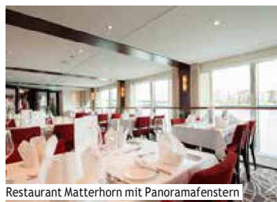
Restaurant Matterhorn mit Panoramafenstern