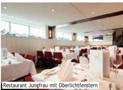
Restaurant Jungfrau mit Oberlichtfenstern