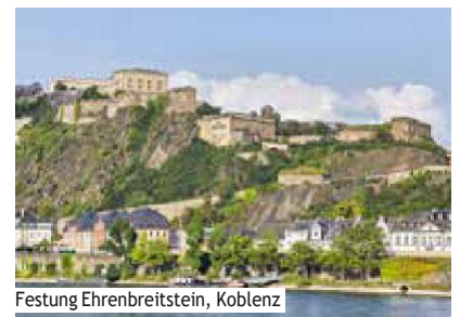
Festung Ehrenbreitstein, Koblenz