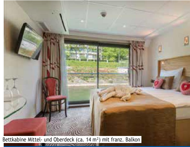
Bettkabine Mittel- und Oberdeck (ca. 14 m 2 ) mit franz. Balkon